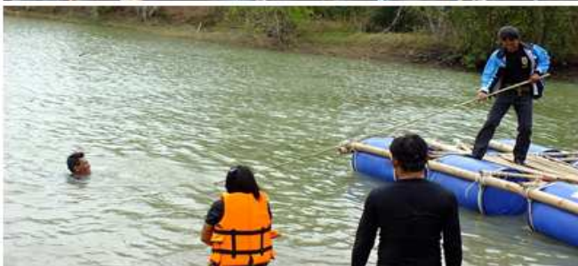
ประชุมสภา อบต.คึมใหญ่ พิจารณาจ่ายขาดเงินสะสม ประจำปี พ.ศ. ๒๕๖๑