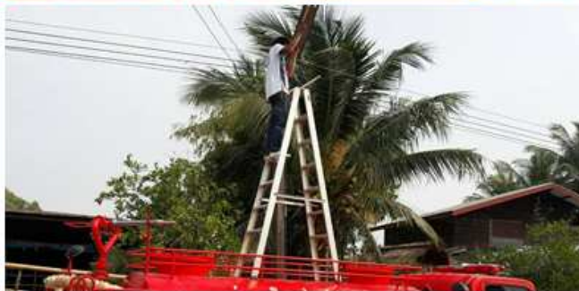
ช่วยกันดับไฟป่า บ้านคึมใหญ่และบ้านภูเขาขาม