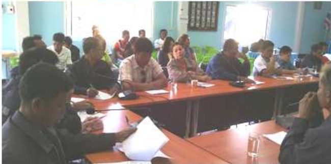
ขับเคลื่อนโครงการไทยนิยม ยั่งยืน เเวทีที่ ๑