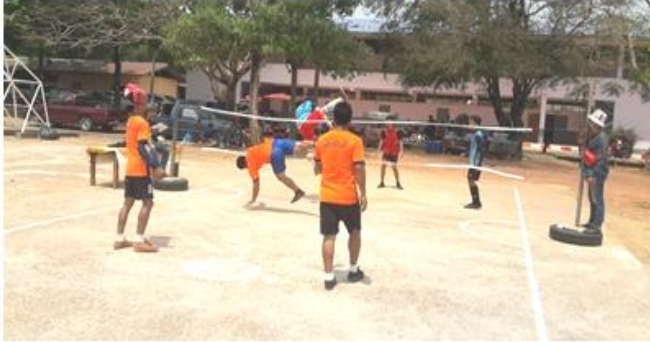
ประเภทกีฬา “วอลเลย์บอล”