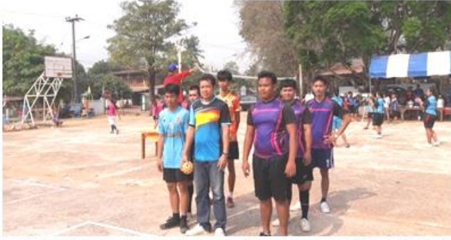
ประเภทกีฬา “เซปักตะกร้อ”