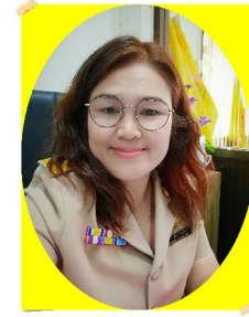
อบต.คุณธรรม ธรรมะในแผ่นดิน ฉบับ ป.คิมใหญ่