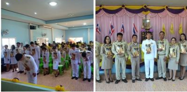
ประชุมชมรมผู้สูงอายุ เปิดโรงเรียนผู้สูงอายุ รุ่น ๒