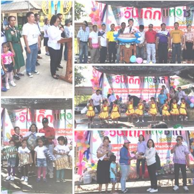
พนักงานส่วนตำบล ออกกำลังกายทุกวันพุธ