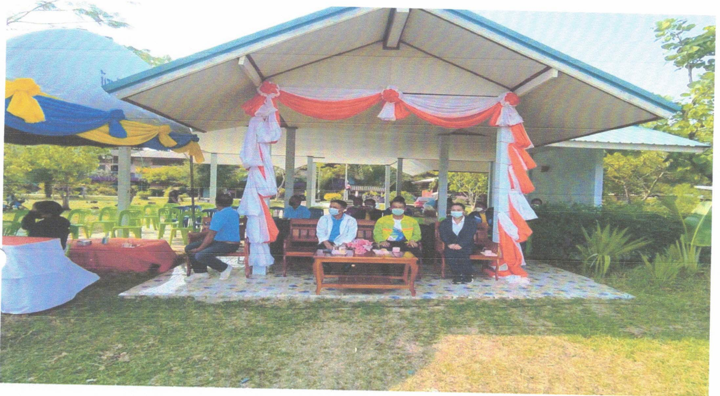
ภาพประกอบพิธีเปิด โครงการการแข่งขันกีฬา อบต.คีมใหญ่ ด้านยาเสพติดประจำปี ๒๕๖๕ วันที่ ๘ เมษายน ๒๕๖๕ ณ โรงเรียนบ้านคีมใหญ่