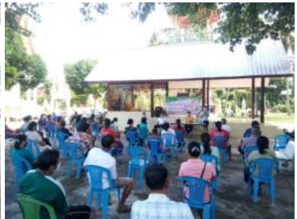
(2) จัดกิจกรรมรณรงค์สร้างความตระหนักในการฉีดวัคซีนประชาชนเพื่อสร้างภูมิคุ้มกันโรค (วัคซีนโควิด -19) ในพื้นที่องค์การบริหารส่วนตำบลคึมใหญ่