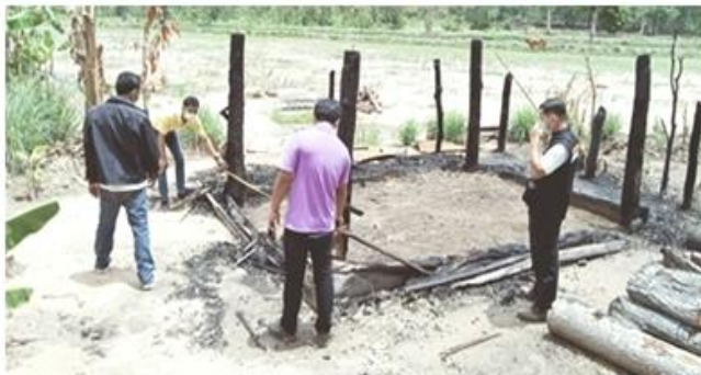
โครงการสำรวจยืนยันข้อมูลแบบแสดงรายการที่ดินตามบัญชี แสดงรายการที่ดินและสิ่งปลูกสร้าง